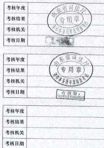
律师事务所年度检查考核记录